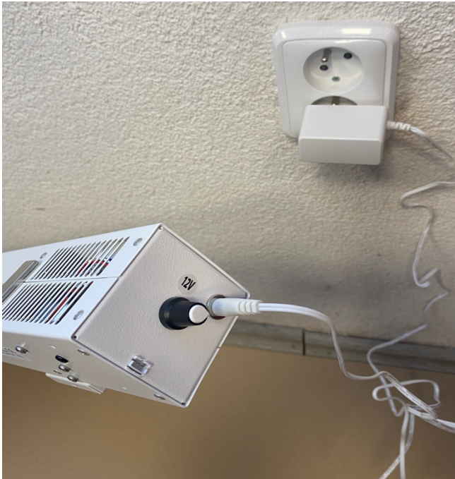
Obr.1 Zapojení adaptéru